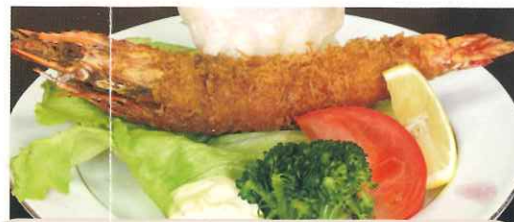
若の湯名物「ジャンボフライ」