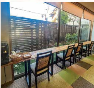
湯上りにカウンター席で一休み

全室椅子とテーブルで足もラクラクくつろぎ空間。 ベッド設置のお部屋もございます。