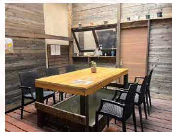
憩いの場として足湯