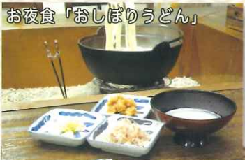
お夜食「おしぼりうどん」