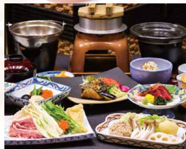
左:信州牛の鉄板焼き/右:ご夕食